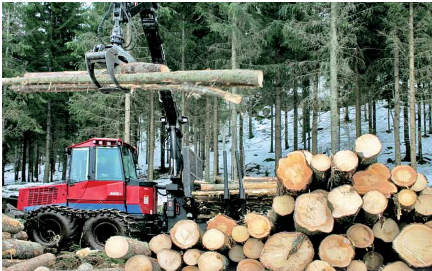
Tømmerprisene fikk et nytt løft etter sommerferien og nærmer seg nå nivået fra før finanskrisen.

4 Tømmerprisene fortsetter å stige, og nå melder samtlige norske aktører om en prisøkning på 15-30 kr fra august, både for massevirke og sagtømmer. Dermed nærmer vi oss prisnivået forut for finanskrisen.