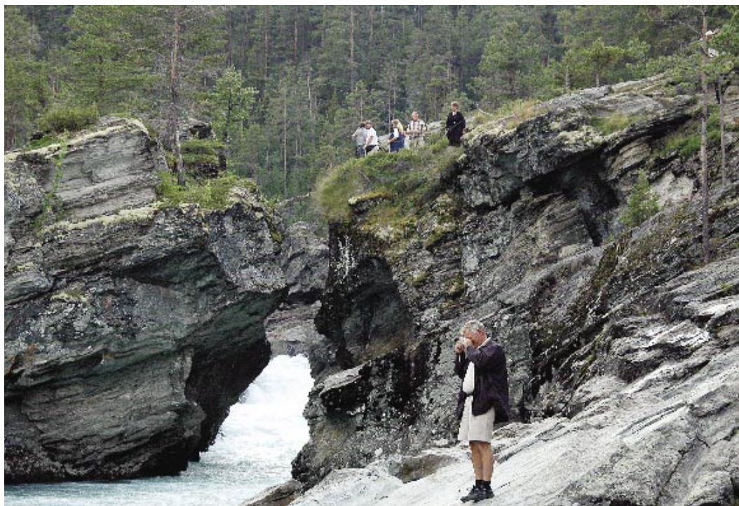
Ridderparanget er en nasjonal severdighet som besøkes av tusenvis av turister hvert år. Den ligger midt i almenningen.