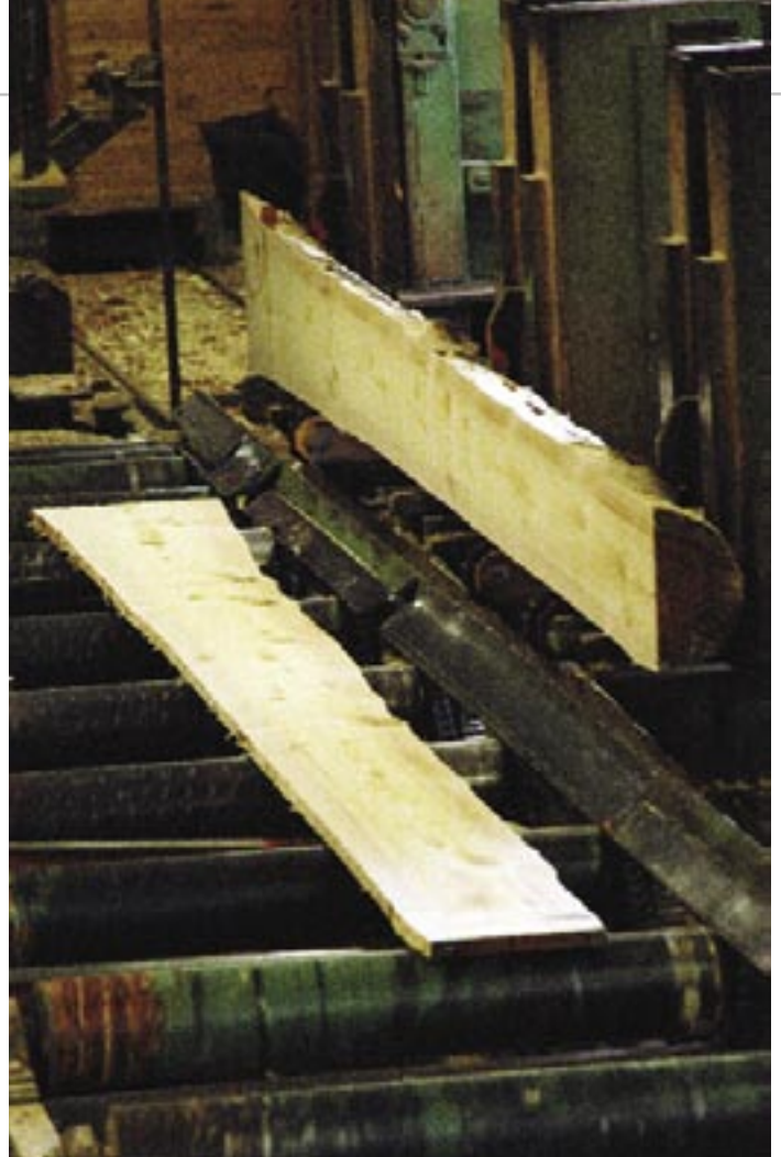
Villmarkspanel fra Langmorkje som selges til hytter overalt mellom Trøndelag og Rauland

– Kraftverket produser 7 GWh som blir levert Eidefoss kraftsel-